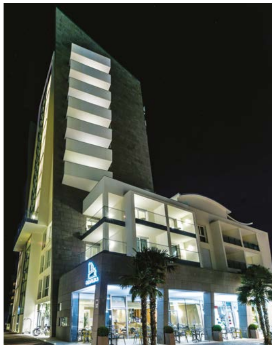
Facciate continue, infissi scorrevoli & Ponzi balconade Curtain walls, sliding frames & Ponzi balconade