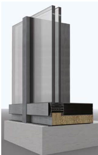
Facciate continue strutturali isolanti Structural insulating curtain walls