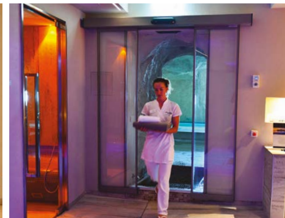
Ponzi ASD 2 ante ridondante, per ingresso SPA e piscine Ponzi redundant ASD 2 wings, for SPA and pools entrance

La vera innovazione nel settore delle chiusure dedicate all'hotel è l'installazione di porte automatiche nel suo percorso interno, idonee alla compartimentazione tra gli ambienti. Oltre all'isolamento acustico e termico sono funzionali per isolare gli ambienti dal traffico della reception, per creare trasparenza ed illuminazione naturale, e come delimitazione di ambienti vari. Come progettisti ed architectural designer Ponzi colloca la porta automatica nei più diversi contesti diventando un complemento di arredo contemporaneo ed innovativo ad alto contenuto tecnologico. Nel settore alberghiero e della ristorazione, sono apprezzate per la compartimentazione sala-ristorante, per corridoi, per vani scale ed ascensori, centri benessere e SPA. Inoltre le porte automatiche Ponzi scorrevoli, pieghevoli o con movimentazione a battente, facilitano il rapido ed agevole passaggio del personale di servizio con carrelli, stoviglie e biancheria, evitando il contatto o l'urto con le ante in movimento.