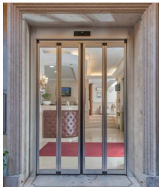
Ante pieghevoli in chiusura Folding wings closed position

FDA TOS - INNOVAZIONE PORTA PIEGHEVOLE ANTIPANICO FDA TOS - INNOVATION FOLDING ANTIPANIC DOOR