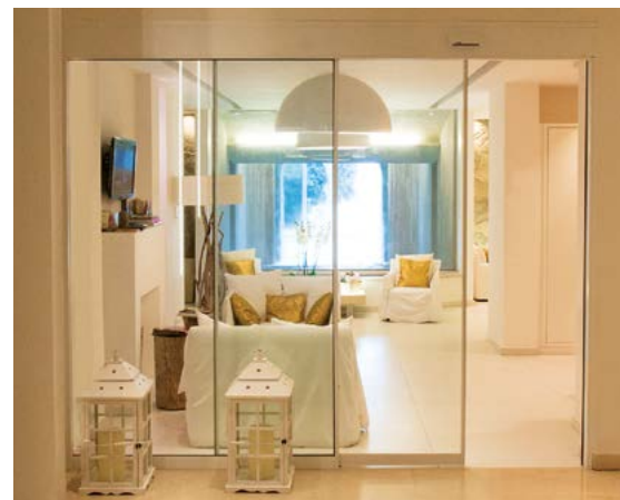
Ponzi ASD profili da 20 mm per compartimentazioni interne Ponzi ASD with slim 20 mm profiles for internal partitions