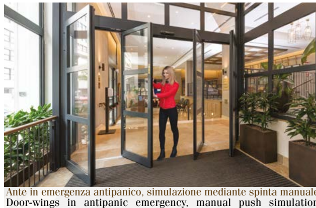
Ante in emergenza antipanico, simulazione mediante spinta manuale Door-wings in antipanic emergency, manual push simulation