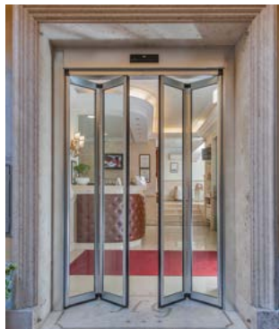
Ante pieghevoli in movimento Folding door wings in operation