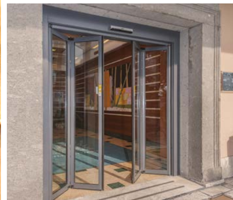
FTA in movimento, in edificio storico vincolato FTA folding automatic door - Historical context

La porta automatica pieghevole PONZI FDA è realizzata in 4 ante pieghevoli con sezione ridotta da 30 mm ed installata nei vani di passaggio da 1000 mm a 2000 mm. La porta Ponzi FDA TOS è la soluzione ideale per gli hotel nel centro storico, che necessitano di via di fuga, ma che hanno vani con ingombro ridotto e privi di spazi laterali. È indicata dove vi siano restrizioni e vincoli nell'edificio, che non permettano l'uso delle soluzioni scorrevoli e sia necessario un agevole passaggio di traffico misto persone e bagagli, in ottemperanza alle normative richieste per la via di fuga. Sono certificate secondo le Direttive Comunitarie ed idonee all'uso come uscite di sicurezza.