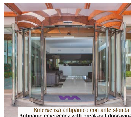
Emergenza antipanico con ante sfondate Antipanic emergency with break-out door-wings