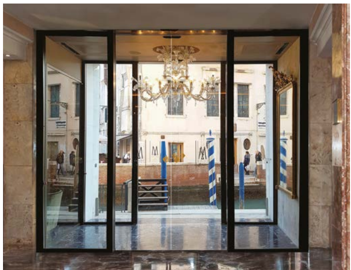
Porta automatica Ponzi ASD a 2 ante tutto vetro temperato spessore 10 mm Ponzi ASD automatic door with 2 wings in temperate glass 10 mm thickness