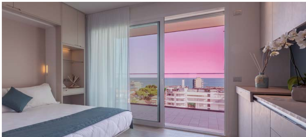
Porta finestra scorrevole sistema "Alza e Scorri", vetrate Ponzi, parapetti Balconade Ponzi sliding door with lift up and slide opening system for an easy use and top insulation