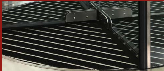
PONZI SCRUB - zerbino tecnico in sola gomma pulente per traffico pesante PONZI SCRUB - technical mat with rubber suitable for shoes cleaning