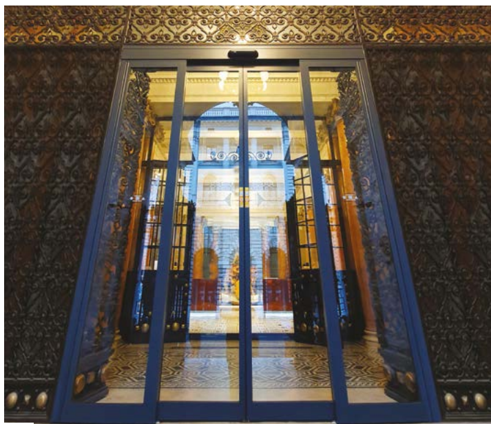
Porta automatica scorrevole antipanico Ponzi TOS, con profilati slim 30 mm Ponzi TOS automatic antipanic sliding door, with 30 mm slim profiles

Le ante delle porte automatiche Ponzi possono essere realizzate con profilati da 50, 30, 20 mm e isolanti a taglio termico. Le porte telescopiche Ponzi sono la soluzione per gli ingressi di dimensioni ridotte, dove le ante non possono scorrere lateralmente. Sono realizzati a 2 ante a scorrere, su muro o parete, o sulla lineare fissa. Il vano viene liberato per i 2/3 della larghezza totale, e reso idoneo all'abbattimento delle barriere architettoniche. Sono disponibili in versione monolateral e bilateral. Le porte automatiche scorrevoli Ponzi sono realizzate secondo le recenti normative europee con stile, tecnologia e funzionalità.