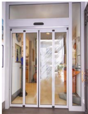
Ante pieghevoli in chiusura Folding wings closed position