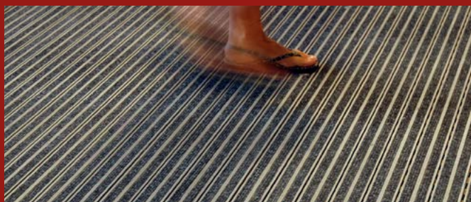
PONZI NEW CABLE - zerbino con cavi in acciaio ed elementi in tessuto/alluminio PONZI NEW CABLE - mat with steel cables and aluminium/carpet elements

Gli zerbini tecnici Ponzi rimuovono lo sporco ed il bagnato dalle suole delle scarpe e sono studiati per l'ingresso dell'hotel e per tutte le aree dove vi è molto passaggio di persone e bagagli. Sono realizzati abbinando i profilati di alluminio estruso a lamelle longitudinali di gomma riciclata, di materiali tessili, moquette o spazzole. La rigidità degli elementi favorisce il passaggio delle ruote di trolley e carrelli. Sono reversibili, quindi con durata doppia, antitorzione, oppure arrotolabili. È consigliabile il loro utilizzo ad incasso, con anello in alluminio o acciaio inox da premurare. Ponzi technical doormats remove dirty and wet from shoes and they are designed for hotel entrances and all areas where there is a high traffic of people and luggage. They are made by matching extruded aluminum profiles with longitudinal rubber (recycled) blades of fabrics, carpet or brushes. The rigidity of the elements favors the passage of the wheels of trolleys and carts. They are reversible, so with double lifetime, anti-torsion or they can be rolled up. The use of this doormat is recommended with an aluminum or stainless-steel ring that must be pre-fixed on the floor.