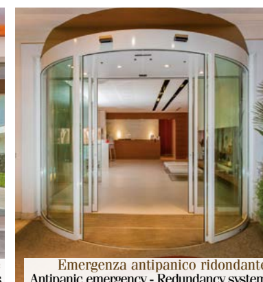
Emergenza antipanico ridondante Antipanic emergency - Redundancy system