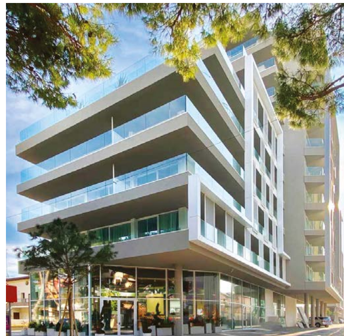
Hotel: ingressi ed infissi Ponzi, serramentistica completa "chiavi in mano" Hotel: doors & windows, Ponzi operate as contractor for the complete building