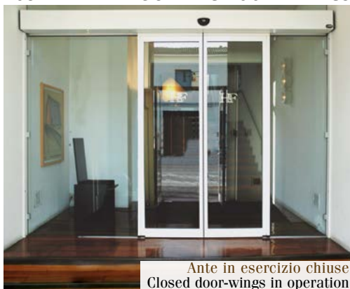
Ante in esercizio chiuse Closed door-wings in operation

TOS 2R SCORREVOLE 2 ANTE ANTIPANICO TOS 2R ANTIPANIC SLIDING DOOR 2 WINGS