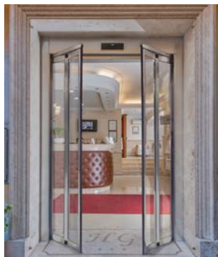
Emergenza antipanico, ante sfondate Antipanic emergency broken wings