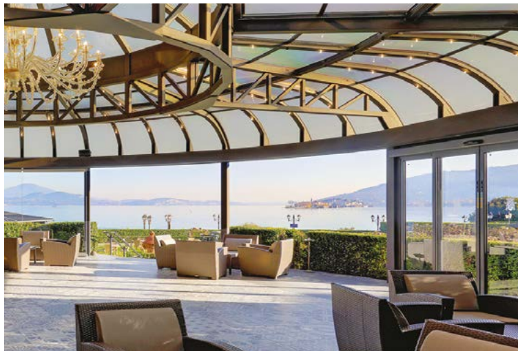
Vetrate scorrevoli Ponzi certificate con profilati termici per il risparmio energetico Ponzi certified sliding glass doors with thermal profiles for energy saving