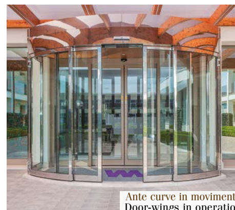
Ante curve in movimento Door-wings in operation