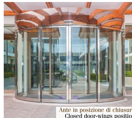
Ante in posizione di chiusura Closed door-wings position