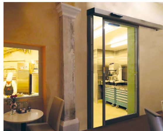
Ponzi ASD scorrevole a 1 anta mobile per laboratorio pasticceria Ponzi ASD automatic sliding door 1 wing for pastry laboratory