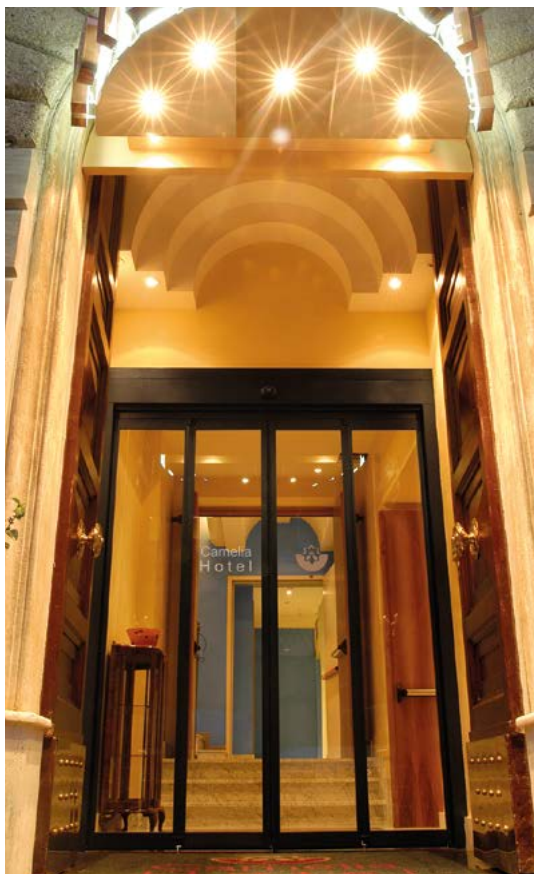
Porta automatica pieghevole antipanico, hotel centro storico Folding automatic antipanic door for historical building