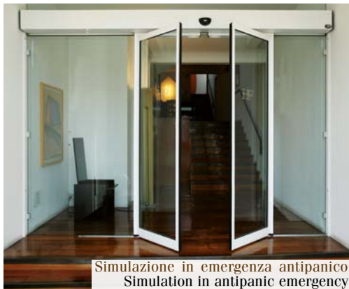
Simulazione in emergenza antipanico Simulation in antipanic emergency