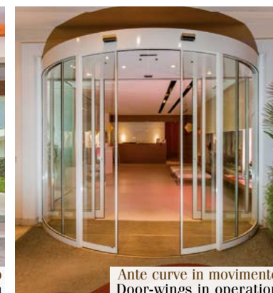
Ante curve in movimento Door-wings in operation