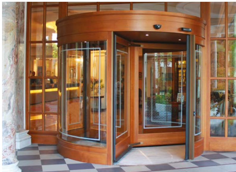
Porta girevole automatica in legno Exclusive a 3 ante per alberghi di stile e prestigio Exclusive wood automatic revolving door, 3 wings for style and prestigious hotel entrances

Con oltre 1000 porte girevoli installate Ponzi è l'unico produttore italiano e leader negli ingressi girevoli, con numerose referenze nel settore alberghiero. Pioniere nel campo delle porte automatiche ha sviluppato un'unica ed estesa competenza e specializzazione negli ingressi girevoli che creano un impatto architettonico esclusivo e donano all'edificio un ottimo isolamento termico ed acustico, eliminando le correnti d'aria nella hall d'ingresso, creando una maggiore salubrità dell'ambiente. Si presentano inoltre come deterrente per gli accessi indesiderati. La gamma di porte girevoli Ponzi, a tre o quattro ante sviluppa diametri da 2000 fino a 3800 mm. Diversi sono i materiali utilizzati: alluminio, acciaio inox, bronzo, ottone e legno con diverse possibilità di personalizzazione.