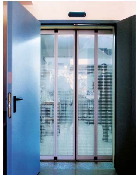
Porta pieghevole FDA abbinata a EI tagliafuoco FTA folding door combined with fireproof door EI