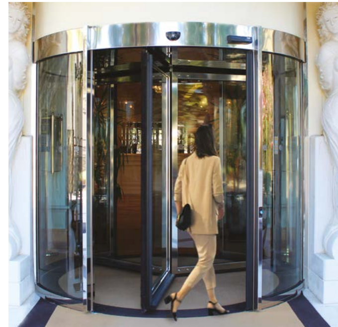
Ponzi girevole automatica 3 ante in acciaio inox lucido a specchio, design hotel Ponzi revolving automatic door 3 wings in mirror stainless steel, hotel design

For contemporary and design hotels, Ponzi offers special revolving doors in stainless steel or full glazed that can be inserted in curtain walls and in the hall. The revolving doors can have an optional glass roof, reduced central column and the drive unit positioned inside the floor. Our large doors have an internal diameter of 3600 to 6000 mm, and they combine the rotating and sliding function for a comfortable passage of people and luggages. The purpose of the hotel facilities realized by Ponzi is to create an entry of prestige and quality combined with industry 4.0 and craft made skills.