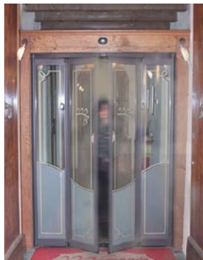
Sfondamento ante - spinta manuale Wings breaking - manual push