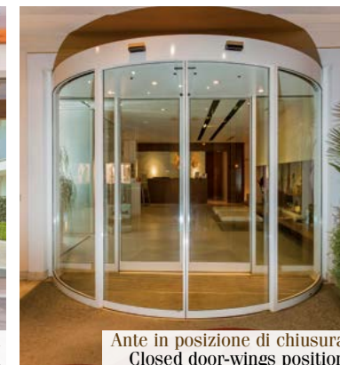
Ante in posizione di chiusura Closed door-wings position