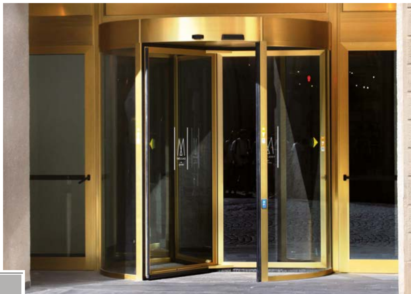
Ponzi PG porta girevole automatica a 4 ante in alluminio con finitura speciale oro brillantato Ponzi PG 4 wings automatic revolving door aluminum surface treatment gold anodized