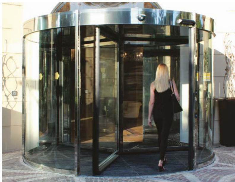
Ponzi PG porta girevole automatica a 3 ante con finitura in acciaio inox lucido a specchio Ponzi PG automatic revolving door 3 wings with mirror stainless steel finish