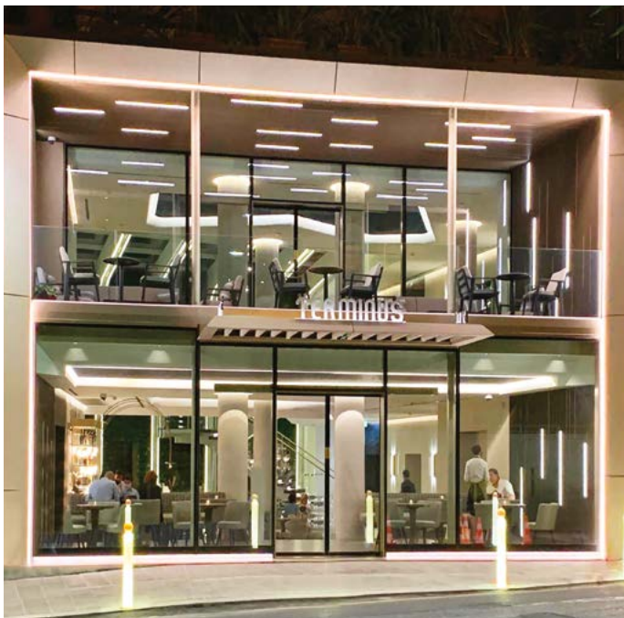
Facciate Ponzi energy saving ad alto isolamento acustico Ponzi energy saving facades with high sound insulation