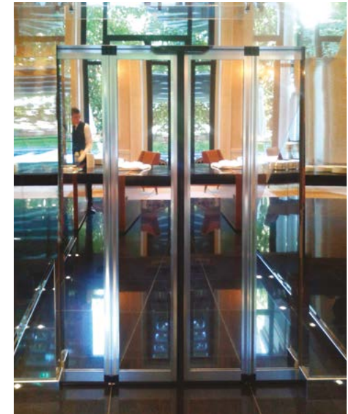
Porta pieghevole FDA realizzata con vetri a specchio FDA folding door made with mirrored glass