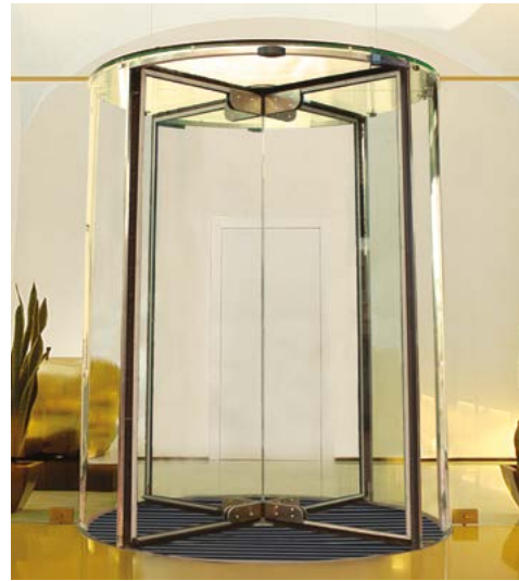
PG Vitrum con ante e ciellino in vetro, motore a pavimento PG Vitrum with all-glass wings and ceiling, floor mounted engine