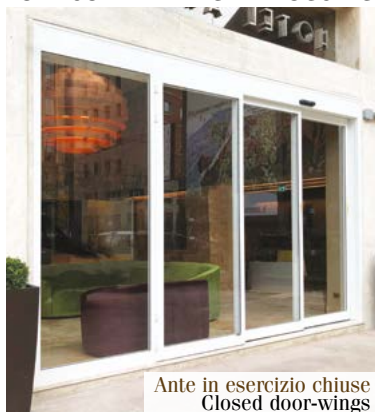
Ante in esercizio chiuse Closed door-wings

TSATOSTELESCOPICAANTIPANICO TSA TOS ANTIPANIC TELESCOPIC