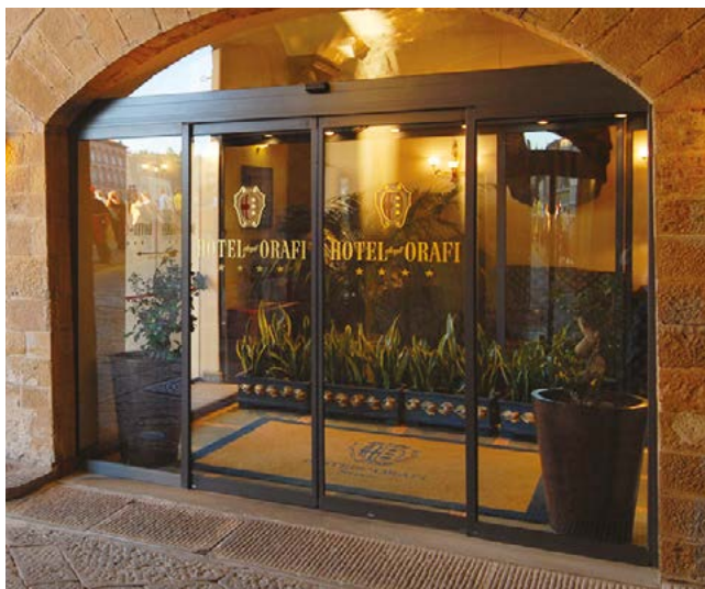
Bussola scorrevole Ponzi ASD in alluminio con ante e con profili da 20 mm Ponzi ASD sliding doors with slim 20 mm aluminium profiles door-wings