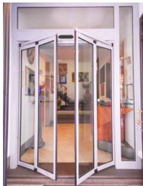
Ante in emergenza antipanico Door-wings antipanic emergency