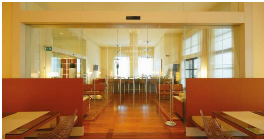
Porta scorrevole Ponzi ASD 4 ante tutto vetro, per divisioni interne sala ristorante e lounge Ponzi ASD sliding door with 4 glazed wings, for internal division restaurant / lounge