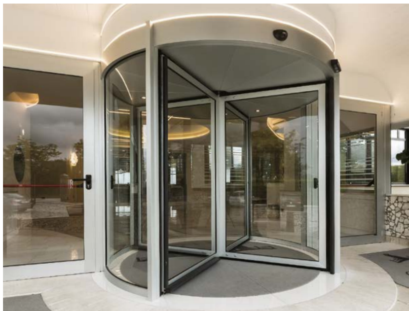
Ponzi PG porta girevole automatica a 4 ante in alluminio verniciato finitura RAL Ponzi PG 4 wings automatic revolving door in aluminum coated RAL finish