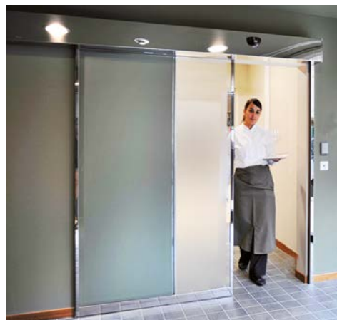
Ponzi ASD in acciaio inox per passaggio cucina-sala Ponzi ASD in stainless steel for kitchen-dining room passage