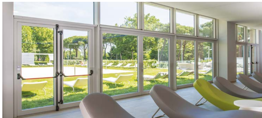
Ampie vetrate per edifici sostenibili ad elevata tenuta termica ed acustica con profilati e vetri isolanti Large facades for sustainability buildings with high thermo acoustic performance