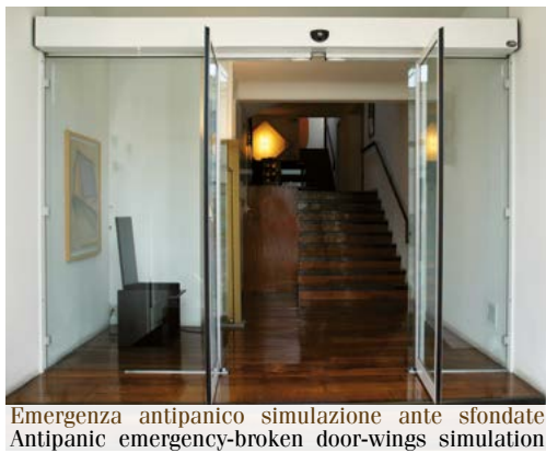
Emergenza antipanico simulazione ante sfondate Antipanic emergency-broken door-wings simulation