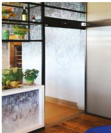
Ponzi ASD porta scorrevole anta tutto vetro Ponzi ASD sliding all glazed door-wing