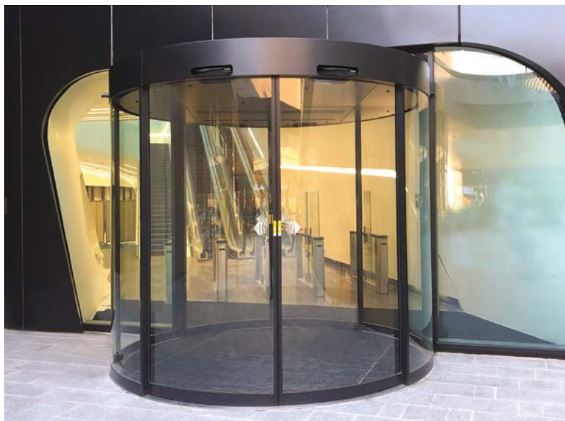
Bussola circolare Ponzi Ronda con profili da 20 mm, inserita nel progetto di Zaha Hadid Ponzi Ronda circular compass with 20 mm profiles, included in Zaha Hadid's project