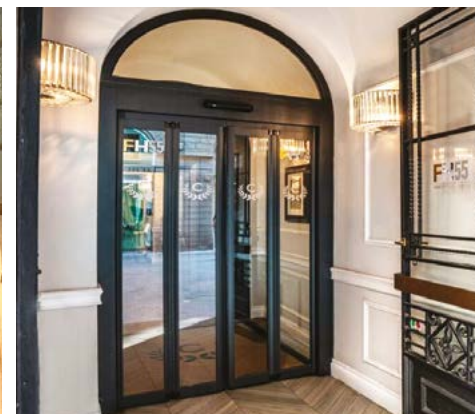
Porta pieghevole antipanico, ingresso principale Automatic antipanic folding door for reduced entry