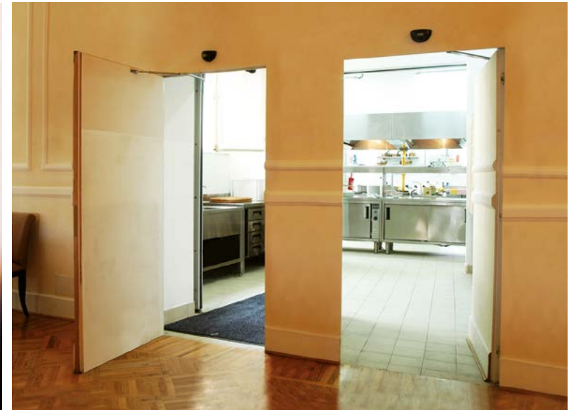
Porte ALU a battente con movimentazione a senso unico di marcia Ponzi ALU hinged doors with automatic one-way entrance/exit for dining-kitchen