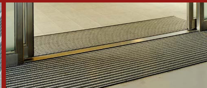
PONZI TIRE - zerbino tecnico ad alto potere pulente ed assorbimento del bagnato PONZI TIRE - technical mat with high cleaning power and wet absorption