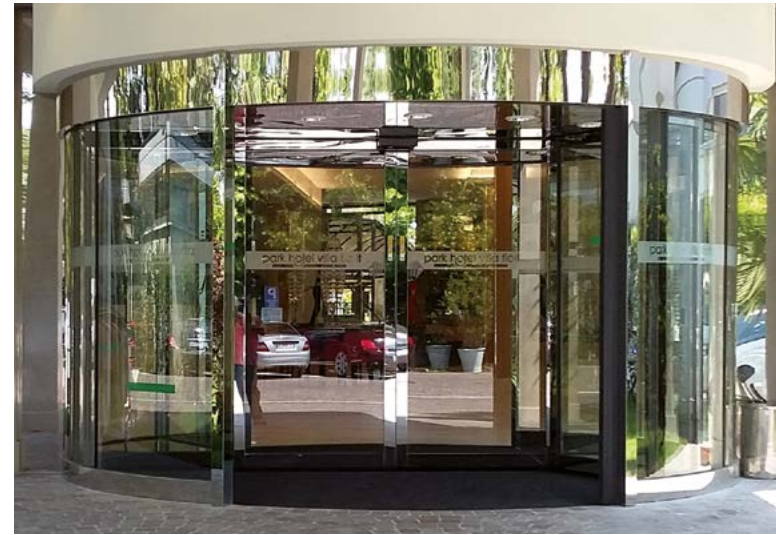
Porta girevole automatica con doppia funzione rotante e scorrevole per alti flussi di traffico Automatic revolving door with double function rotating and sliding for high traffic flow

Per alberghi contemporanei e di design, Ponzi propone porte girevoli speciali in acciaio inox anche di grandi dimensioni, da inserire nelle facciate e nell'ingresso. Le porte girevoli possono avere come optional tetto in vetro, colonna centrale ridotta e motore incassato a pavimento. La tipologia di porte di grandi dimensioni è fornita a due ante, con diametro interno da 3600 a 6000 mm, ed abbina la funzione girevole a quella scorrevole per un comodo passaggio misto di persone e bagagli. Creare un ingresso di prestigio e qualità con sapienza artigianale e tecnologia industriale, mediante macchinari 4.0 è il risultato degli ingressi realizzati dalla Ponzi.