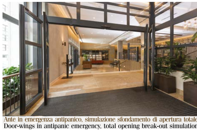
Ante in emergenza antipanico, simulazione sfondamento di apertura totale Door-wings in antipanic emergency, total opening break-out simulation

Ponzi fornisce soluzioni su misura per ogni tipologia di ingresso alberghiero certificato per U.S. e via di fuga ed idoneo per adeguamento delle strutture ricettive alla vigente normativa antincendi. Le porte Ponzi TOS a una, due e quattro ante sono la soluzione per gli ingressi quando è richiesto il vano completamente libero, abilitato a via di fuga ed emergenza, con la semplice pressione manuale, più agevolmente di un maniglione antipanico. Le ante si spalancano a battente verso l'esterno, liberando in questo modo tutto il vano, per il passaggio di bagagli ingombranti e l'abbattimento delle barriere architettoniche. Il ripristino del funzionamento scorrevole delle ante avviene con il riposizionamento delle ante nelle apposite sedi con rapidità e sicurezza.