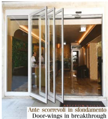
Ante scorrevoli in sfondamento Door-wings in breakthrough