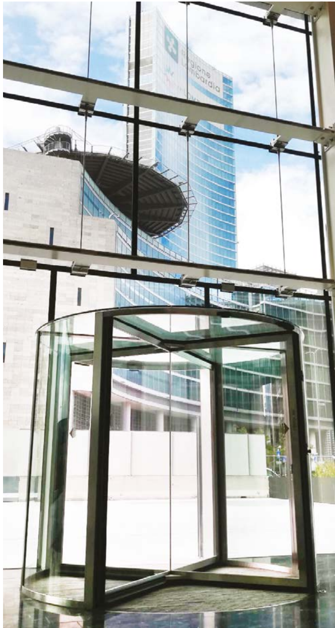
Porta girevole versione "glazed" tutto vetro con motore a pavimento Full "glazed" revolving door with drive unit into the floor