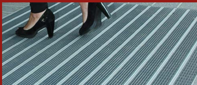
PONZI SCRUB - zerbino tecnico reversibile, robusto e di facile manutenzione PONZI SCRUB - rollable technical mat, robust and easy to maintain