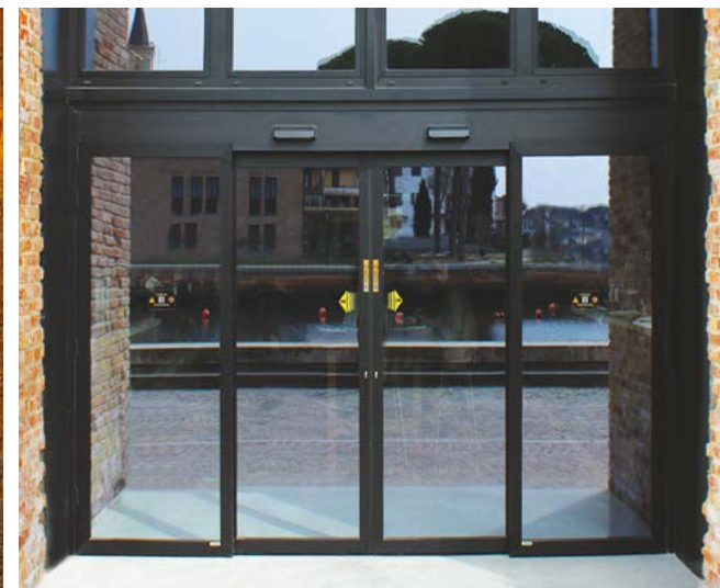
Brevetto Ponzi TOS T.T. porta con dispositivo antipanico a taglio termico Patent Ponzi TOS T.T. antipanic disposal break-out thermal insulated