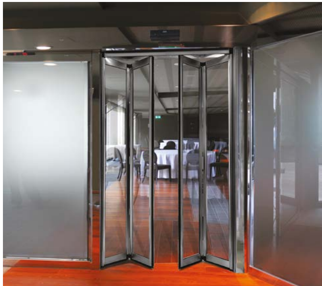
Porta pieghevole FDA simil inox per entrata ed uscita sala ristorante FDA similar stainless steel mirror finish folding door for restaurant entrance