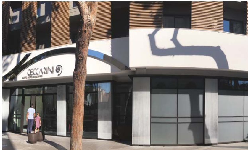
Sistema di facciate per ampliamento di edificio ricettivo con porte automatiche Ponzi Facades system for enlargement receptive building with insertion of Ponzi automatic doors