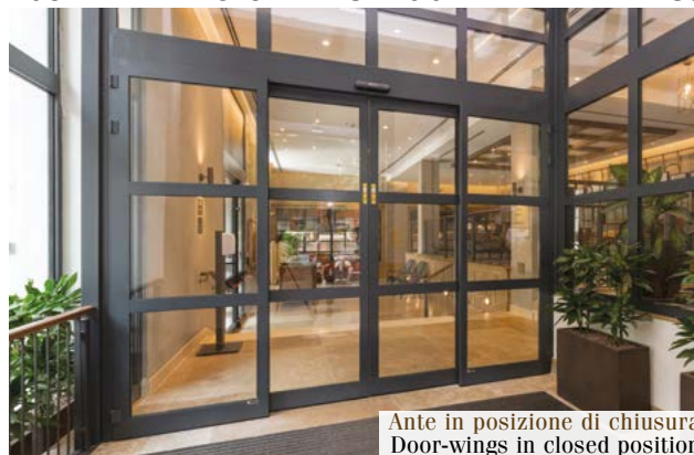
Ante in posizione di chiusura Door-wings in closed position

TOS SCORREVOLE ANTIPANICO A 4 ANTE TOS ANTIPANIC SLIDING DOOR WITH 4 WINGS