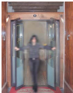
Ante sfondate, uscita di sicurezza Way out, break-out door-wings