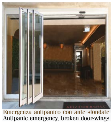
Emergenza antipanico con ante sfondate Antipanic emergency, broken door-wings