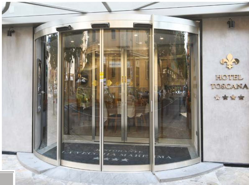
Arco Ribassato per hotel ed ingressi di prestigio a raggio di curvatura variabile Lowered Arch for hotel and prestigious entrances with different radius solutions

Le porte automatiche scorrevoli curve Ponzi sono disponibili in varie tipologie, Rondina semicircolare, Ronda a forma circolare ed Arco Ribassato a raggio variabile. La versione scorrevole Arco Ribassato ha il proprio utilizzo negli ingressi che richiedono caratteristiche di immagine e design come hotels, centri congressi e ristoranti, con necessità di avere l'ingresso abilitato a via di fuga. Un apposito Ente certificatore ne garantisce l'idoneità all'uso per l'uscita di sicurezza. Le ante curve mobili si sfondono con la semplice spinta manuale nel verso dell'uscita, anche durante il normale scorrimento. La porta automatica Arco Ribassato T.O.S. viene utilizzata come porta elegante, in alternativa alle porte girevoli.