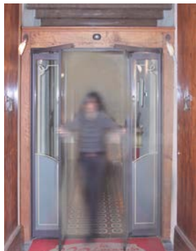
Ante in apertura antipanico Emergency antipanic opening