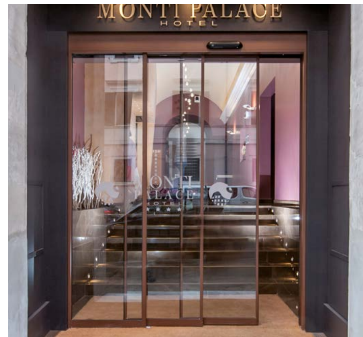
Porta telescopica Ponzi TSA monolateral a 3 ante, con profilati slim 20 mm Ponzi TSA monolateral telescopic door 3 wings and 20 mm slim profiles

Style and functionality are only two of the qualities of the wide range of automatic sliding doors offered by Ponzi. All of them are manufactured according to the latest European standards. The wings can be manufactured with suitable 50 mm round profiles with a reduced section of 30 or 20 mm. Ponzi offers also thermal-break and insulating wings. Ponzi telescopic doors are the ideal solution to enter small areas even where the wings cannot slide sideways. The space passage is free for the 2/3 of the total width, creating an easy entrance for disabled people. The doors can be available both in the monolateral and bilateral version.