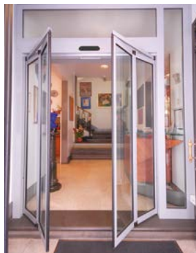
Vano libero, uscita di sicurezza Free opening, for escape route