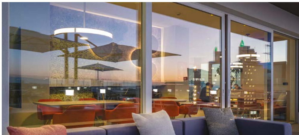
Serramenti e vetrate scorrevoli a taglio termico isolanti "Alza e Scorri" per hotel, residence e cottages Sliding windows thermal break insulated glass "Up and Scroll" for suite rooms, residence and resorts